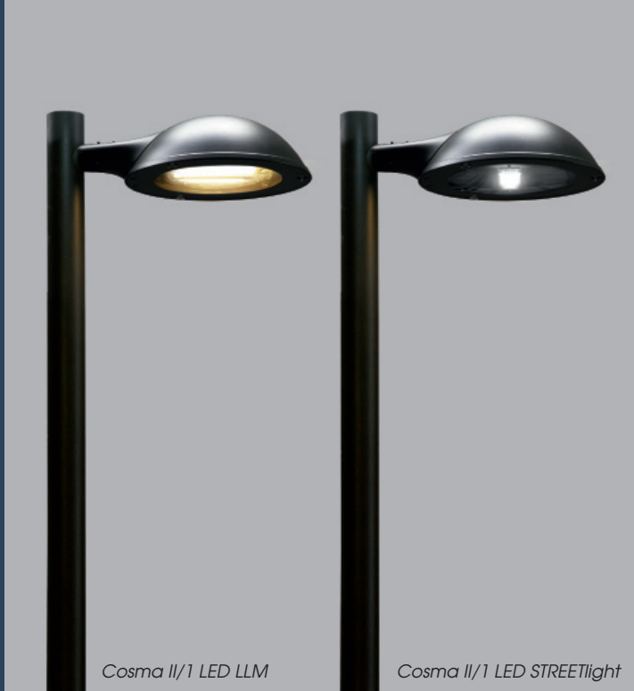
Cosma II/1 LED LLM