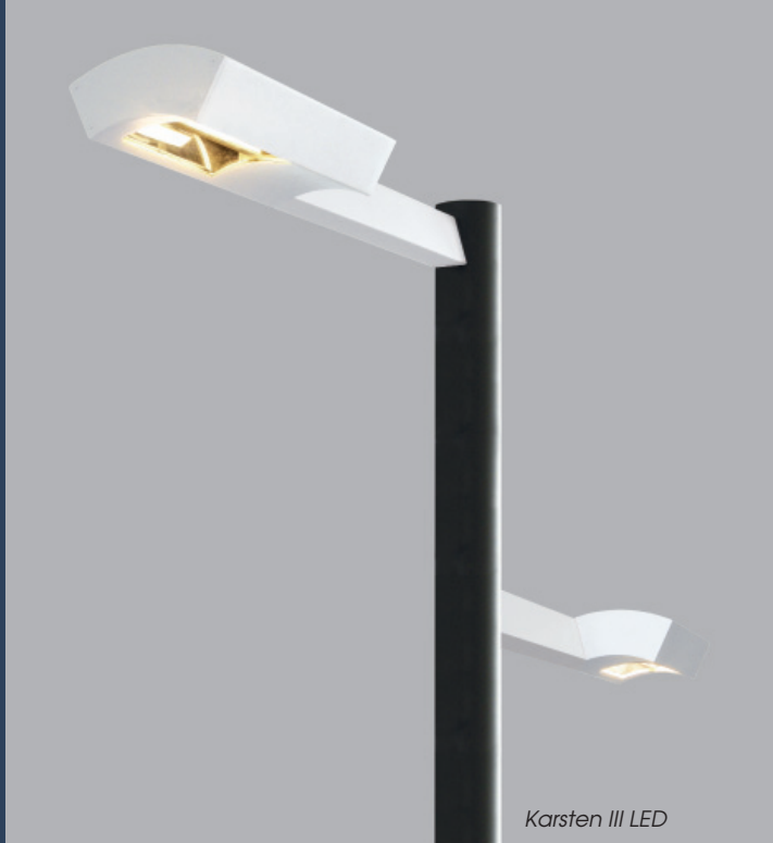
Karsten III LED

Spannung: 230V 50Hz Schutzart: IP 65 Schutzklasse: I bzw. II