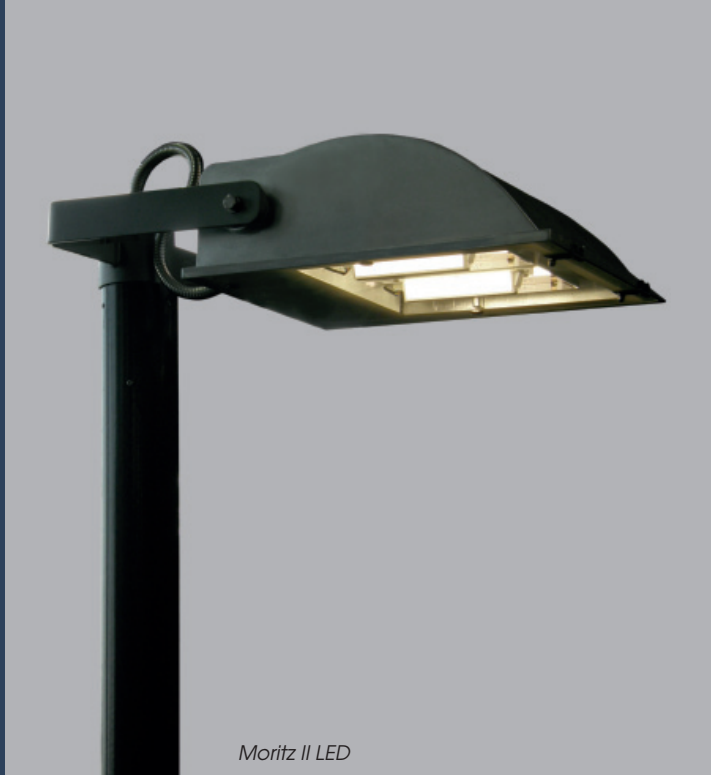
Moritz II LED

Spannung: 230V 50Hz Schutzart: IP 65 Schutzklasse: I bzw. II