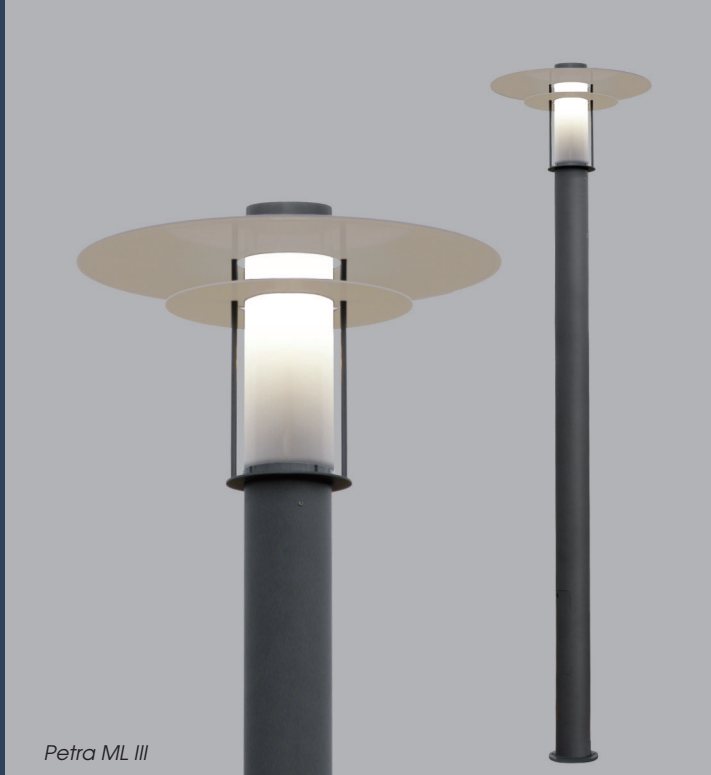
Petra ML III

Dekorative Beleuchtung für Straßen und Wege im städtischen Bereich, in Siedlungen und Parkanlagen. Lichtaustritt allseitig. Für eine Gesamthöhe von 3,50 m oder 4 m